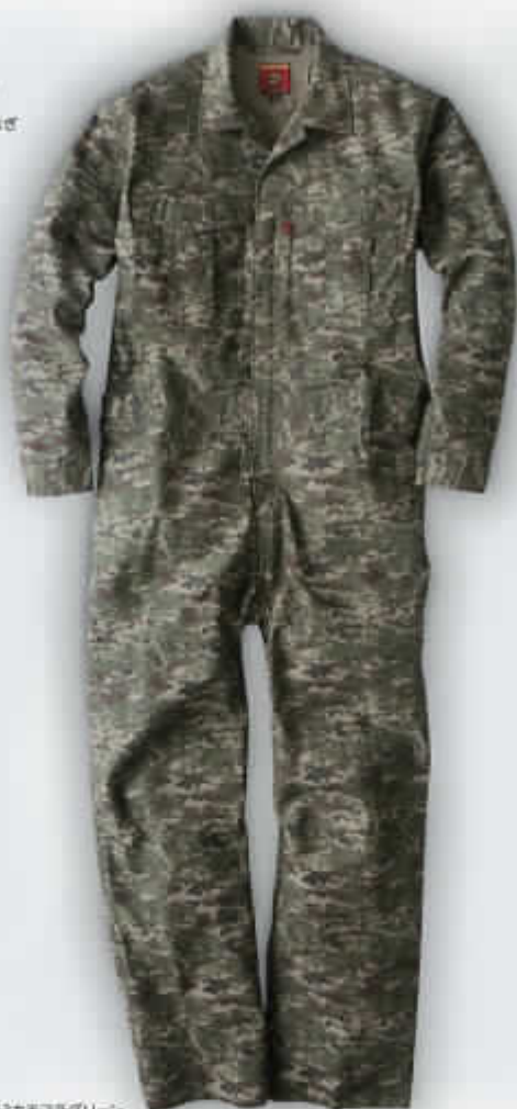
C63カモフラグリーン