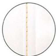
ベージュの ステッチ入り