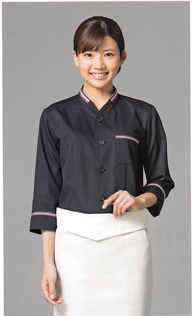
七分袖コックシャツ D8790 本体価格 ¥9,000+税 カラー10(ネイビー) エプロン D1790 本体価格 ¥5,300+税 カラー21