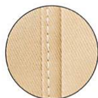
ホワイトの ステッチ入り