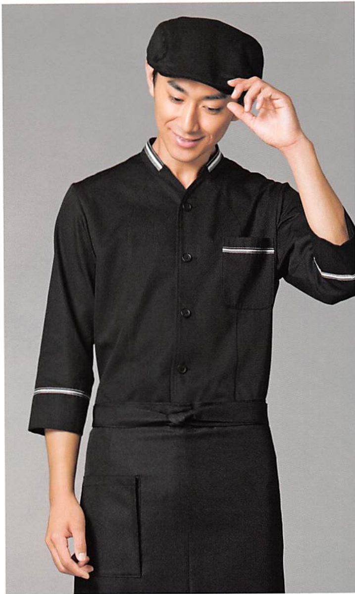
七分袖コックシャツ D8790 本体価格 ¥9,000+税 カラー20(ブラック) エプロン D1382 本体価格 ¥3,500+税 カラー20(ブラック) ※ハンチングは参考商品。