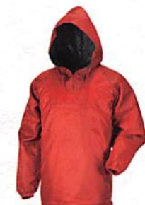
ワイン(40) ※M・L・LL・3Lまで