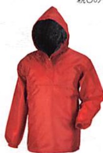
ワイン(40) ※M・L・LL・3Lまで