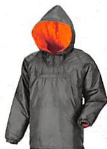
チャコールグレー(74) ※M・L・LL・3Lまで