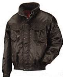
アーミーグリーン(65)