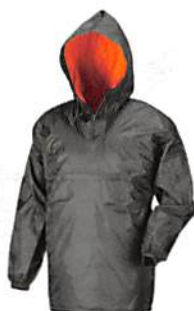
チャコールグレー(74) ※M・L・LL・3Lまで