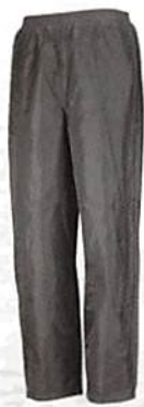
チャコールグレー(74) ※M・L・LL・3Lまで