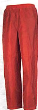
ワイン(40) ※M・L・LL・3Lまで