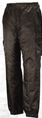
アーミーグリーン(65)