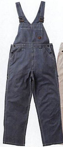
[NB] ネイビーブルー ライトネイビー