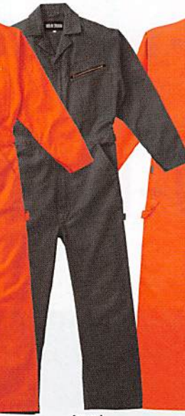
[G2] チャコールグレー