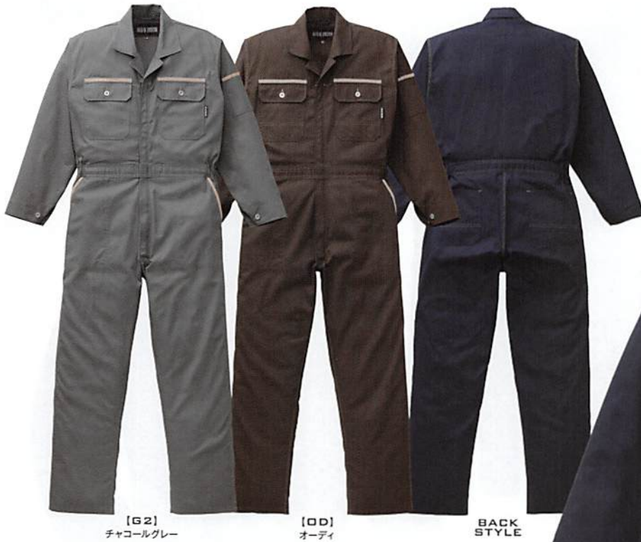
[G2] チャコールグレー