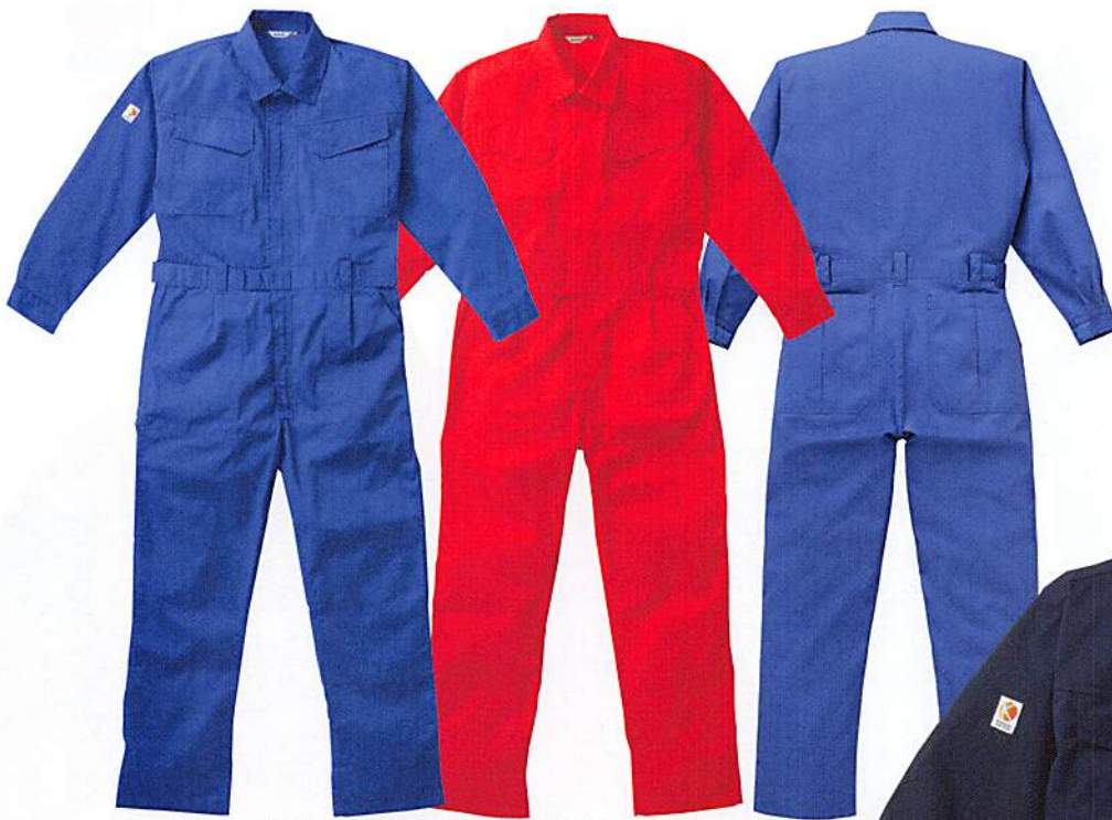
[MB] マリンブルー カンサイマリン