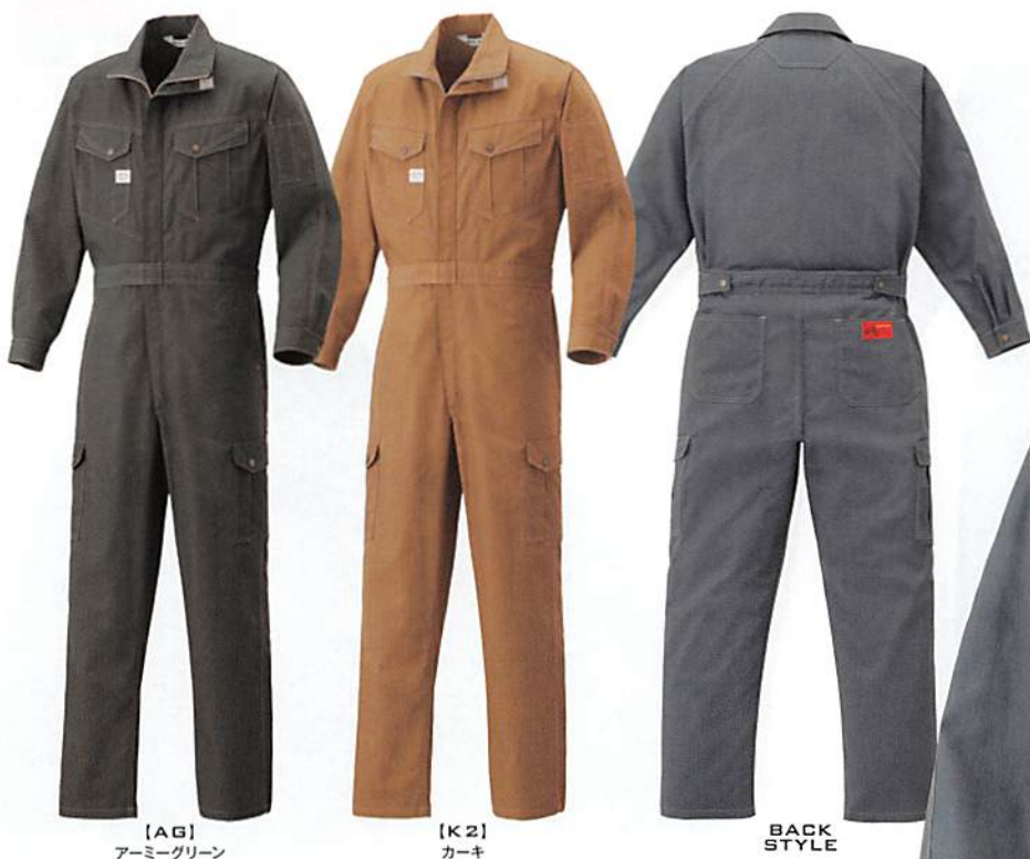
[AG] アーミーグリーン