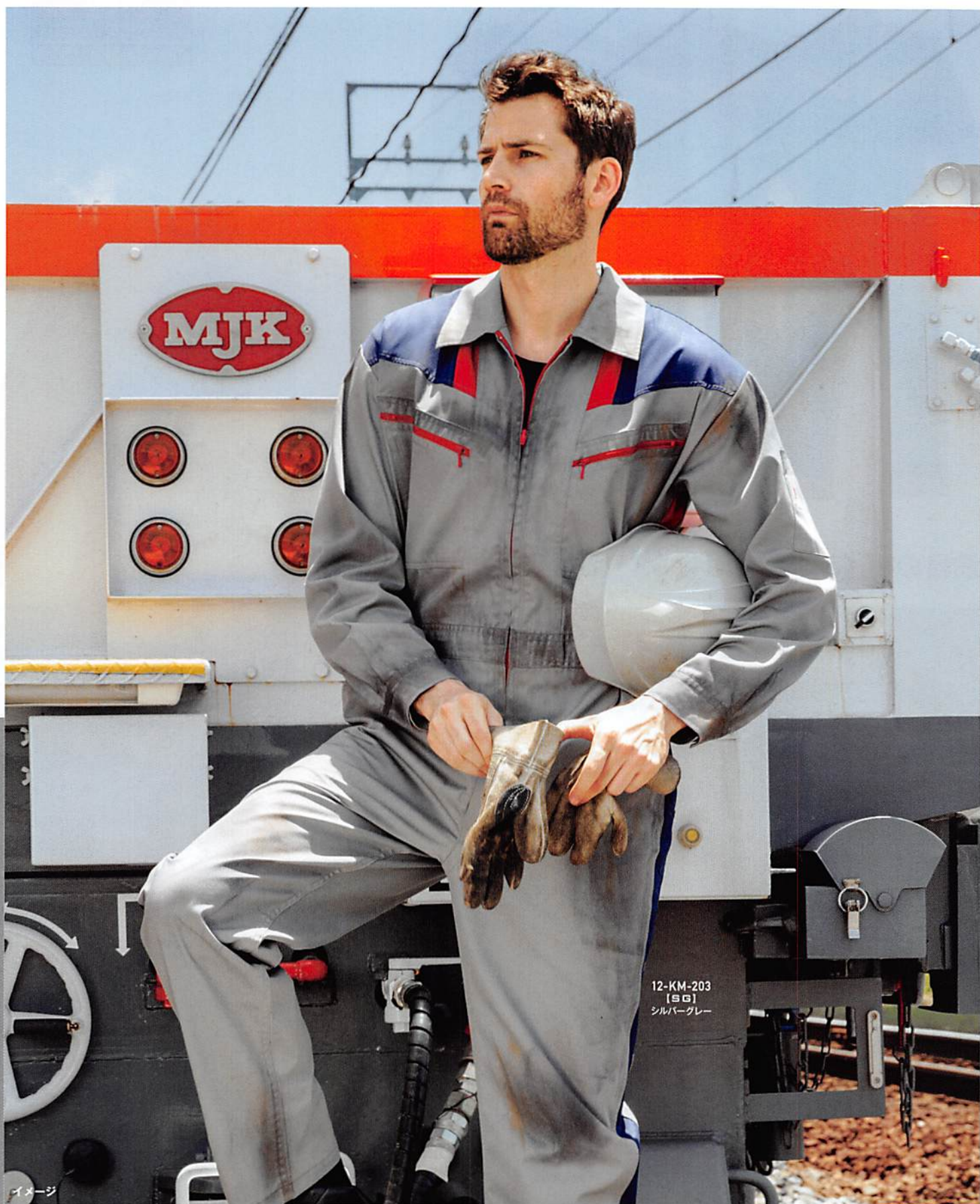
12-KM-203 [SG] シルバーグレー