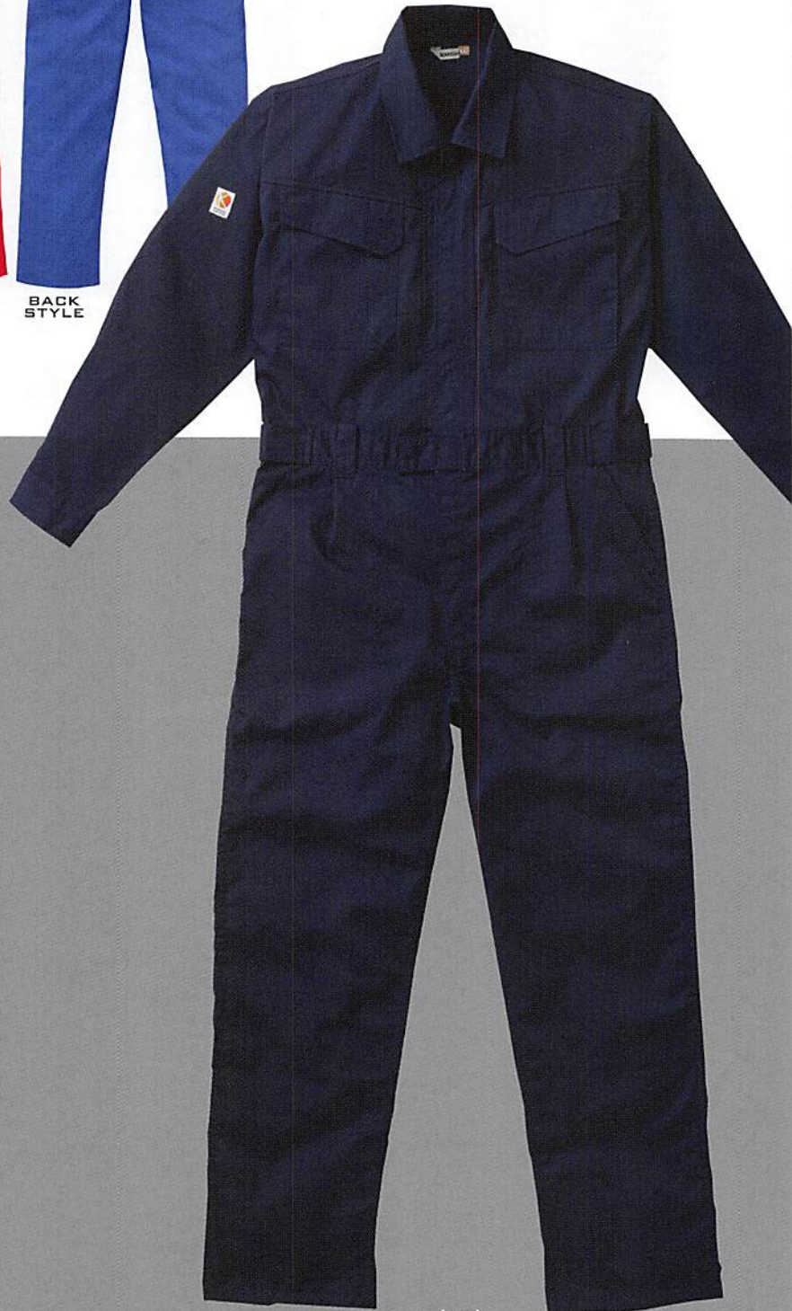
[NB] ネイビーブルー カンサイネイビー