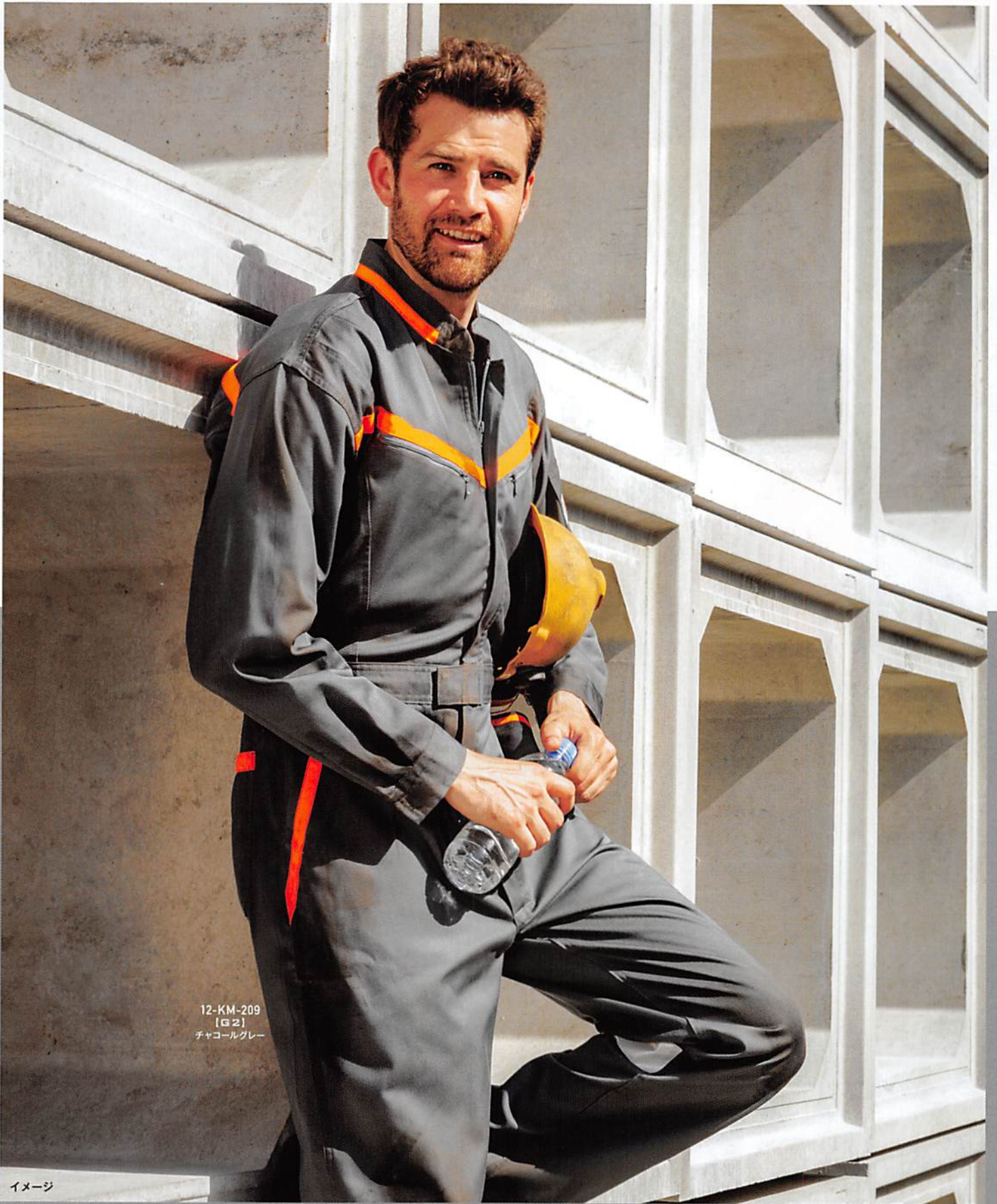
12-KM-209 [G2] チャコールグレー